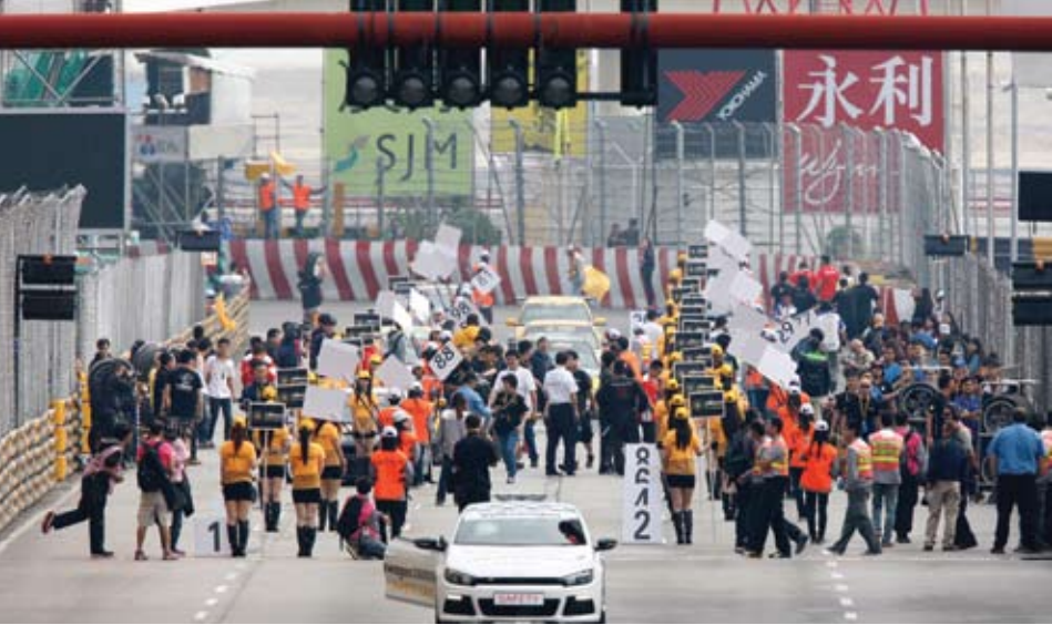
Carro de segurança entrou na pista por causa da chuva

As corridas de apoio do 59o Grande Prémio levaram ao circuito da Guia uma disputa entre Macau e Hong Kong pela pódio. Nas três corridas efectuadas ontem, duas foram ganhas por pilotos locais