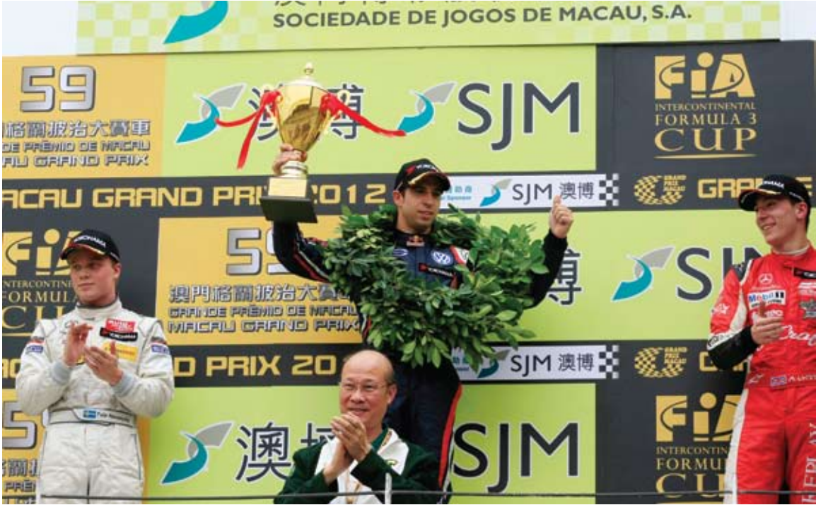
Piloto português ganhou a corrida qualificativa

A satisfação por ter conseguido recuperar a “pole position” era evidente, mas lembrou que a corrida de hoje “é que conta”. Se conseguir a vitória nesta edição da Taça In-